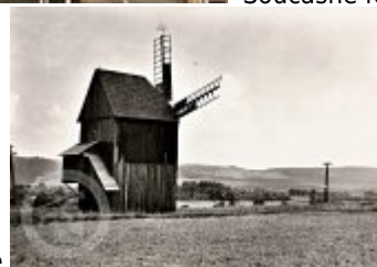
Historické fotografie a pohlednice