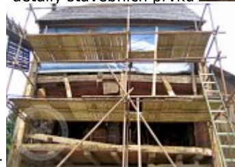
Současné fotografie - objekt