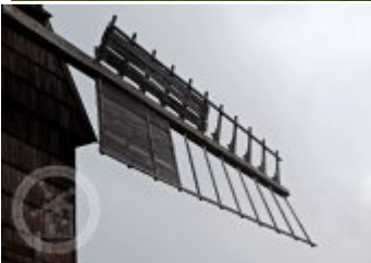
Současné fotografie - technologické vybavení