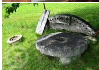
Současné fotografie - exteriér - detaily stavebních prvků