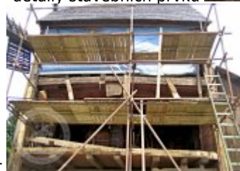
Současné fotografie - objekt