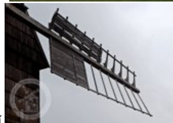
Současné fotografie - technologické vybavení