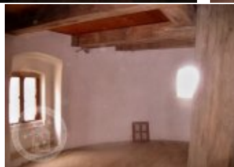
Současné fotografie - objekt