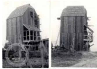
Obč. 13. Převodní kolo na území zámečnického až 17. století, c. 1910 Karel F. Hájek