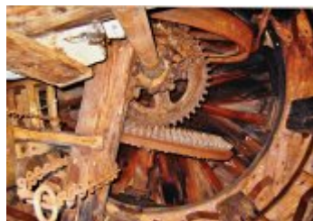
Současné fotografie - exteriér - detaily stavebních prvků