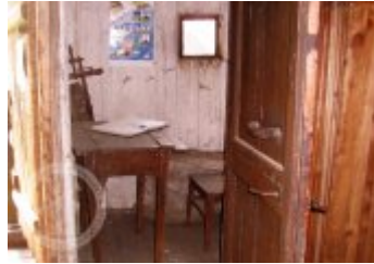
Současné fotografie - interiér - detaily stavebních prvků