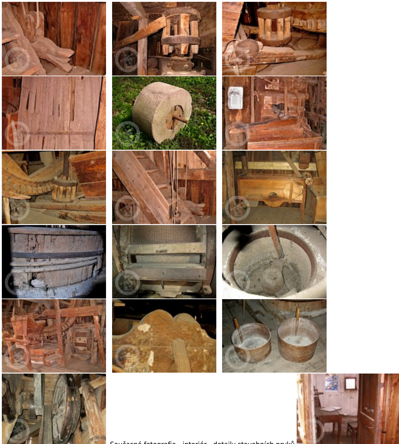
Současné fotografie - interiér - detaily stavebných prvků