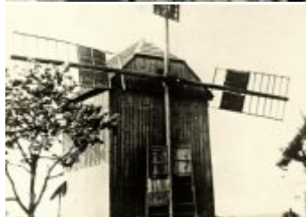
Současné fotografie -