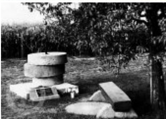
Současné fotografie -