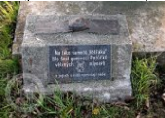
Historické fotografie a pohlednice