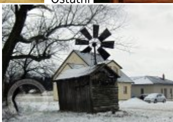
fotografie a pohlednice