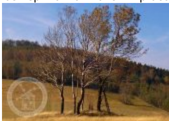
Dolního Vítkova a z kroniky farní. Fotogalerie Základní obrázky