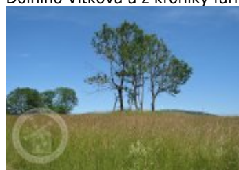
Současné fotografie - objekt v krajině