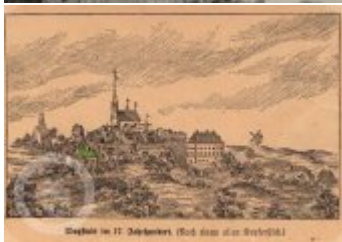
Stribert im 17. Jahrhundert. (Nach einer alten Ansichtskarte)