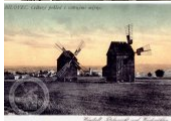
Windmolen bei Stribert