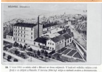
18. V roce 1910 na místě stálo v Blüwe ve dvou nádrech. V každém z nich bylo skladiště a mlýn a to vpravo a nalevo. V roce 1914 byly tyto skladiště zrušeny a dosud stojí. Blüwe byla chráněna také stádky obilí chráněnými v blízkosti stádku v Blüwe. Chránila