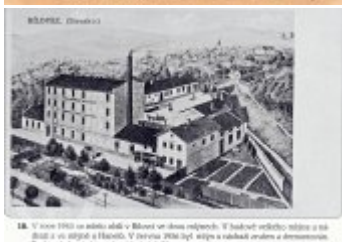
18. V roce 1910 na místě stála v Blüves ve dvou nájemcích. V každém veškeré výroby a má štát a vs. stáje a Havelka. V roce 1914 byl stáje a nájemců a domovních. Budova byla zbudována jako stáje obilí (čerstvá) v blízkosti stáje v Blüves. Chovatel