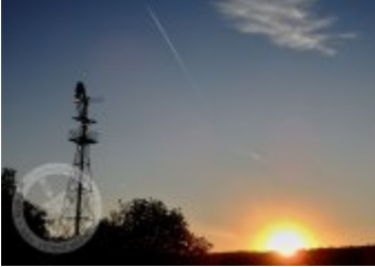
Současné fotografie - exteriér

Literatura a prameny Zajímavosti Ostatní Fotogalerie Současné fotografie - objekt v krajině