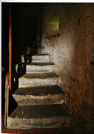
Dochovaná část schodiště