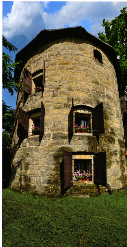
Dnes objekt slouží k rekreačním účelům