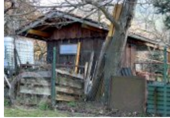
Současné fotografie -