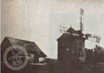
ČESKÉ VĚTRNÍKY III. — VĚTRNÍK U SOBOTKY

Literatura a prameny Zajímavosti Ostatní Foto galerie Historické fotografie a pohlednice