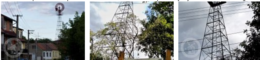
Současné fotografie -

Informace zpracované a platné k 13.02.2017. Literatura a pramenyZajímavostiOstatníFotogalerieZákladní obrázky