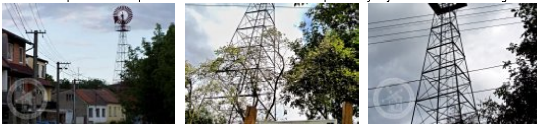
Současné fotografie -

Informace zpracované a platné k 13.02.2017. Literatura a prameny Zajímavosti Ostatní Fotogalerie Základní obrázky