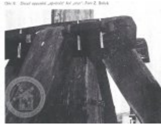
Obč. 6. Detail dřevěné „převodky“ pro první řadu Z. Bělá