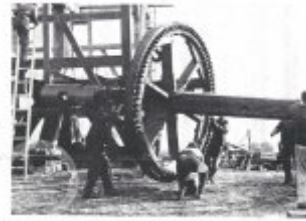
Obč. 12. Příprava dříví o patřičném kalibru.