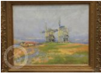
Současné fotografie - objekt v krajině