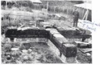
Obč. 8. Základy mlýna v kamenné zdivu.