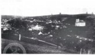
Obč. 1. Pohled na část mlýna ze strany západní strany na Záhradkách č. 17, 1910 Kupříkladu F. Hlaváček