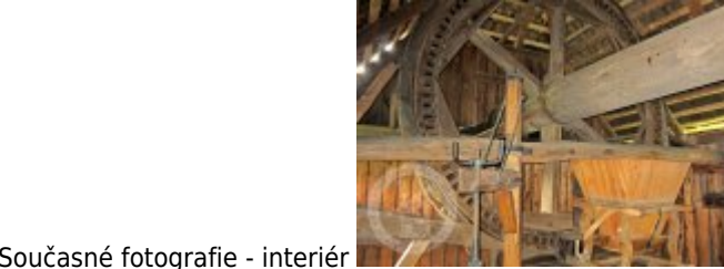
Současné fotografie - interiér