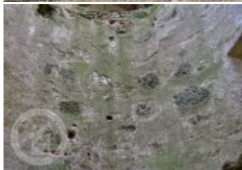
Současné fotografie - exteriér - detaily stavebních prvků