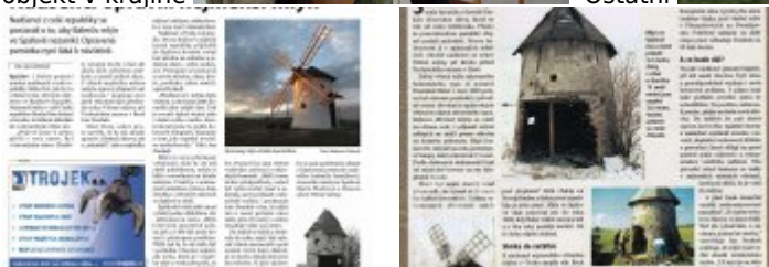
Současné fotografie - exteriér - detaily stavebních prvků