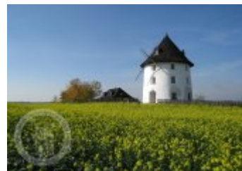
Fotogalerie Historické fotografie a pohlednice