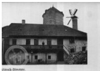
Ústí nad Labem.