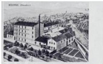
18. V roce 1902 se město stalo v Blatné aneb v okolí Blatné. V blízkosti město a na Blatné a ve střední a Blatné. V roce 1902 byl v blízkosti město a Blatné. Blatná byla přehrána jako Blatná v Blatné v Blatné Blatné.