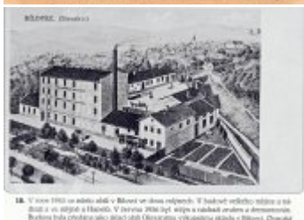
18. V roce 1902 na místě stálo v Blüwe ve dvou nádobách. V každé se nalézalo: mléko a más. Stálo a vs. až poté a Havelka. V červnu 1904 byl, stejně a následně vznikla a domovním. Budova byla zbudována jako stádo obilí (čerstvého) v blízkosti stádo v Blüwe. Chovatel