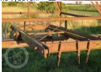
Historické fotografie a