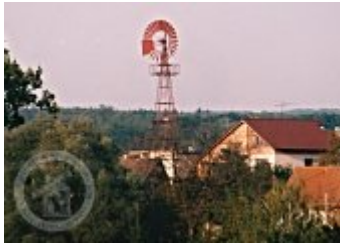
Současné fotografie - objekt v krajíně