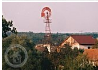
Současné fotografie - objekt v krajině