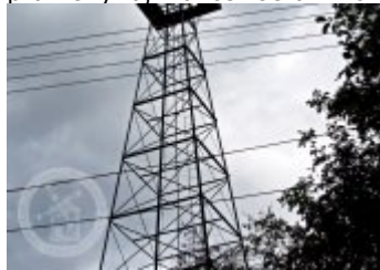
Současné fotografie - technologické vybavení

pramenyZajímavostiOstatníFotogalerieZákladní obrázky