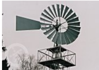
Současné fotografie - objekt v krajině