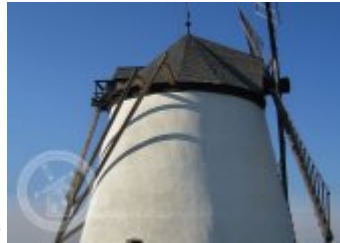
Děkujeme za návštěvu Fotogalerie Základní obrázky

V současné době slouží mlynářův dům jako idylická vinárna, ve které je naléváno víno dozrávající ve vinicích okolo mlýna.