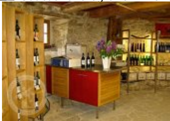
Současné fotografie - interiér