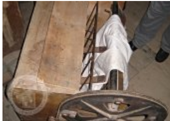
Současné fotografie - interiér - detaily stavebních prvků