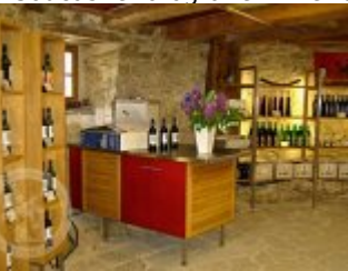
Současné fotografie - interiér - detaily stavebních prvků