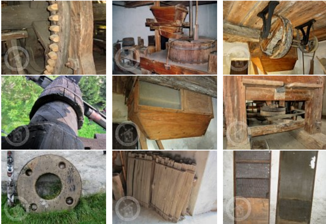
Současné fotografie -