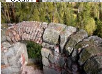
Současné fotografie - objekt