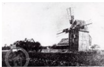
Dřevěný větrný mlýn v Hachovitzu.