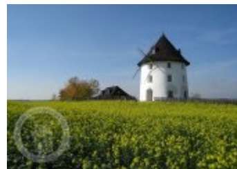
Fotogalerie Historické fotografie a pohlednice