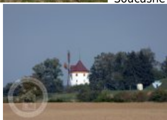
Současné fotografie - objekt v krajině