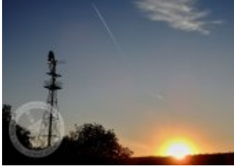
Současné fotografie - exteriér

Literatura a prameny Zajímavosti Ostatní Fotogalerie Současné fotografie - objekt v krajině