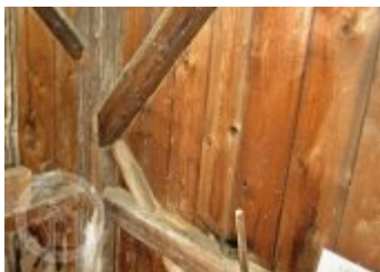
Současné fotografie - exteriér - detaily stavebních prvků