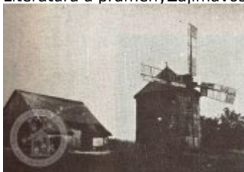
ČESKÉ VĚTRNÍKY III. — VĚTRNÍK U SOBOTKY

Literatura a prameny Zajímavosti Ostatní Foto galerie Historické fotografie a pohlednice