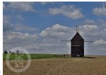
vzduchem-se-uplatnila-take-u-historickyh-mlynu/3591/ PhotogalleryZákladní obrázky

http://www.propamatky.info/cs/zpravodajstvi/cela-cr/tipy-a-inspirace/zpravy-z-katalogu-sluzeb-%7C-metoda-sanace-horkym-