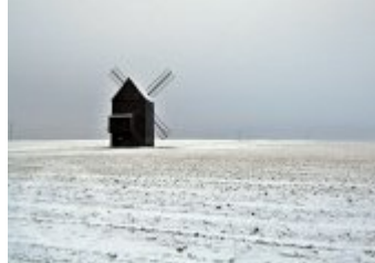
Současné fotografie - objekt v krajině