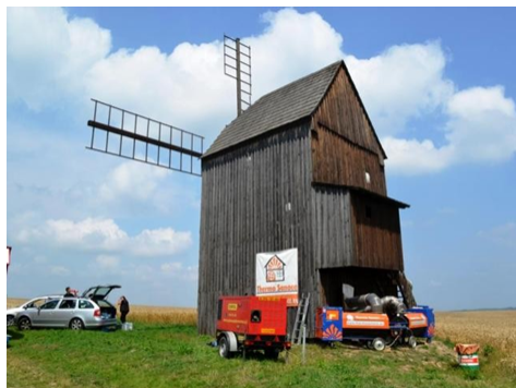
21. 2. 2017 Horkovzdušnou sanaci celodřevěného objektu větrného mlýna realizovala společnost Thermo Sanace. | | Licence: Všechna práva vyhrazena BÍLOVEC, KUNŠTÁT | Celodřevěný mlýn v Novém Dvoře, Bílovci i dřevěné mlecí technologie vodního mlýna v Sychotíně u Kunštátu byly napadeny dřevokazným hmyzem. Na jeho likvidaci byla úspěšně použita sanace horkým vzduchem společnosti Thermo sanace, která je odborným partnerem portálu.