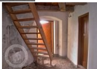
Současné fotografie - interiér - detaily stavebních prvků