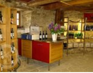
Současné fotografie - interiér - detaily stavebních prvků