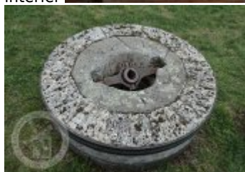
Současné fotografie - objekt v krajině