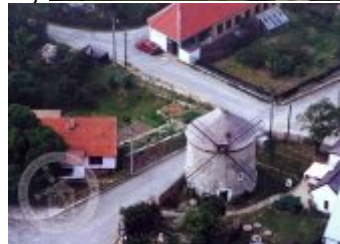
Současné fotografie -