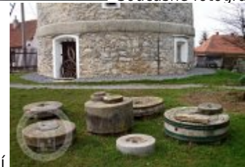
Současné fotografie - technologické vybavení