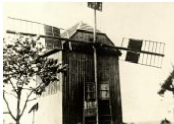
Současné fotografie -