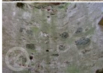
Současné fotografie - exteriér - detaily stavebních prvků