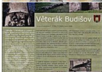
Současné fotografie - exteriér