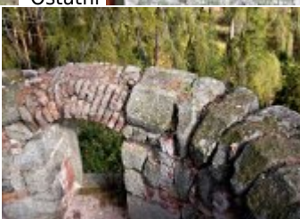
Současné fotografie - objekt