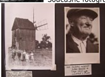
Listinné dokumenty, korespondence