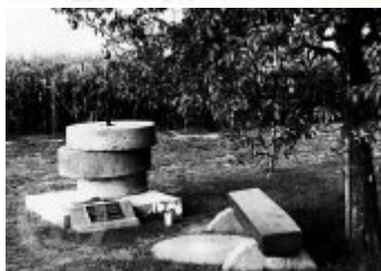
Současné fotografie -