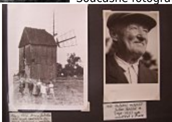
Listinné dokumenty, korespondence