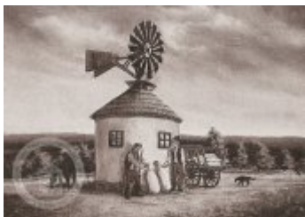
Historické fotografie a pohlednice