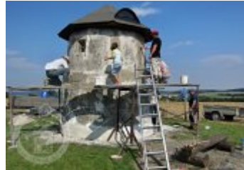
Současné fotografie -