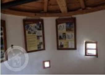
Současné fotografie - interiér - detaily stavebních prvků