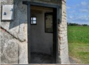
Současné fotografie - interiér