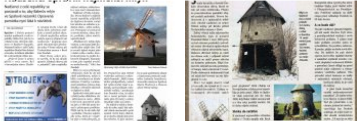
Současné fotografie - exteriér - detaily stavebních prvků