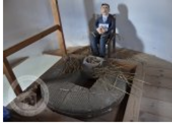
Současné fotografie - technologické vybavení