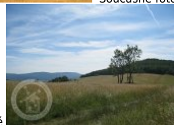
Současné fotografie - objekt v krajině