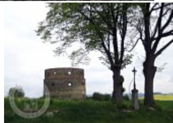
Současné fotografie - objekt v krajině