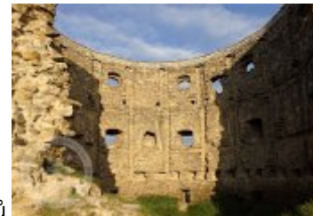
Současné fotografie - exteriér - detaily stavebních prvků