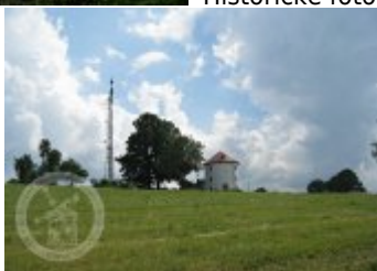
objekt v krajině