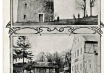
Současné fotografie -