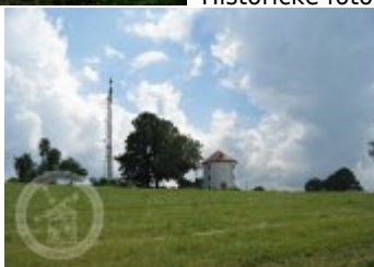
objekt v krajině