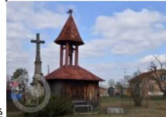
Historické fotografie a