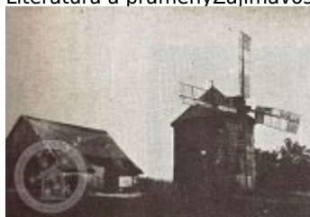
ČESKÉ VĚTRNÍKY III. — VĚTRNÍK U SOBOTKY

Literatura a prameny Zajímavosti Ostatní Photo gallery Historické fotografie a pohlednice