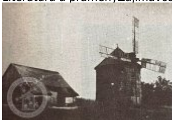
ČESKÉ VĚTRNÍKY III. — VĚTRNÍK U SOBOTKY

Literatura a prameny Zajímavosti Ostatní Photo gallery Historické fotografie a pohlednice