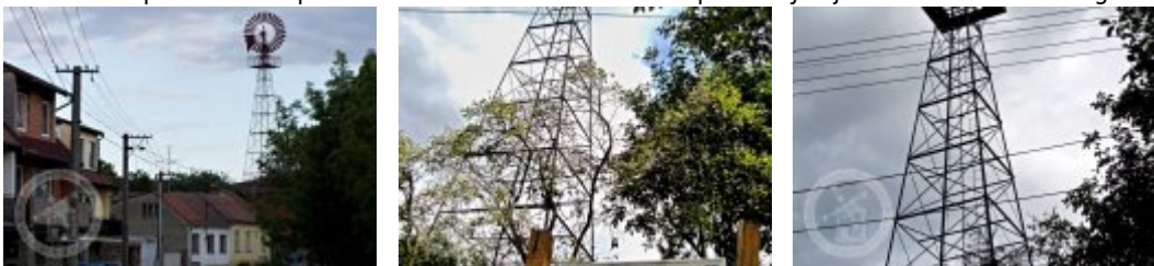
Současné fotografie -

Informace zpracované a platné k 13.02.2017. Literatura a prameny Zajímavosti Ostatní Photogallery Základní obrázky