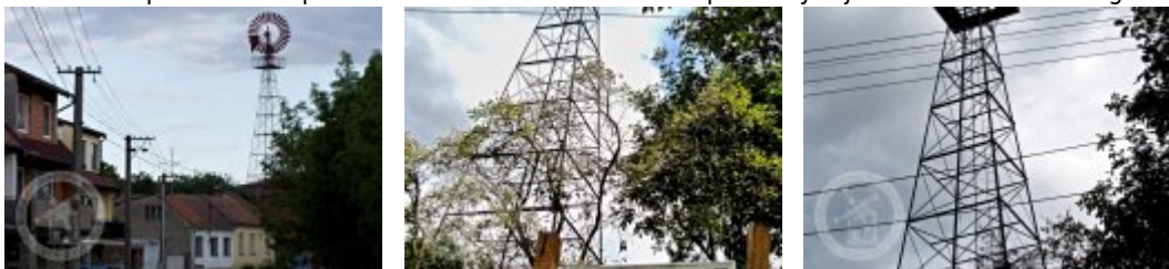
Současné fotografie -

Informace zpracované a platné k 13.02.2017. Literatura a prameny Zajímavosti Ostatní Photogallery Základní obrázky