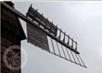
Současné fotografie - technologické vybavení