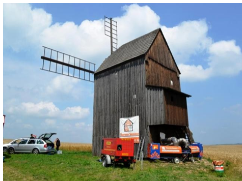
21. 2. 2017 Horkovzdušnou sanaci celodřevěného objektu větrného mlýna realizovala společnost Thermo Sanace. BÍLOVEC, KUNŠTÁT | Celodřevěný mlýn v Novém Dvoře, Bílovci i dřevěné mlecí technologie vodního mlýna v Sychotíně u Kunštátu byly napadeny dřevokazným hmyzem. Na jeho likvidaci byla úspěšně použita sanace horkým vzduchem společnosti Thermo sanace, která je odborným partnerem portálu.