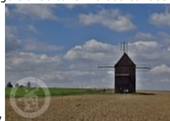
vzduchem-se-uplatnila-take-u-historicky-mlynu/3591/ Fotogalerie Základní obrázky

http://www.propamatky.info/cs/zpravodajstvi/cela-cr/tipy-a-inspirace/zpravy-z-katalogu-sluzeb-%7C-metoda-sanace-horkym-